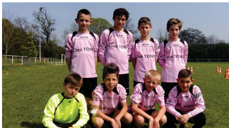
Très bonne saison 2013/2014 pour l'équipe U13