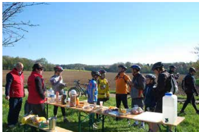
VTT 2015 AVEC 330 PARTICIPANTS Rendez-vous le 24 avril 2016