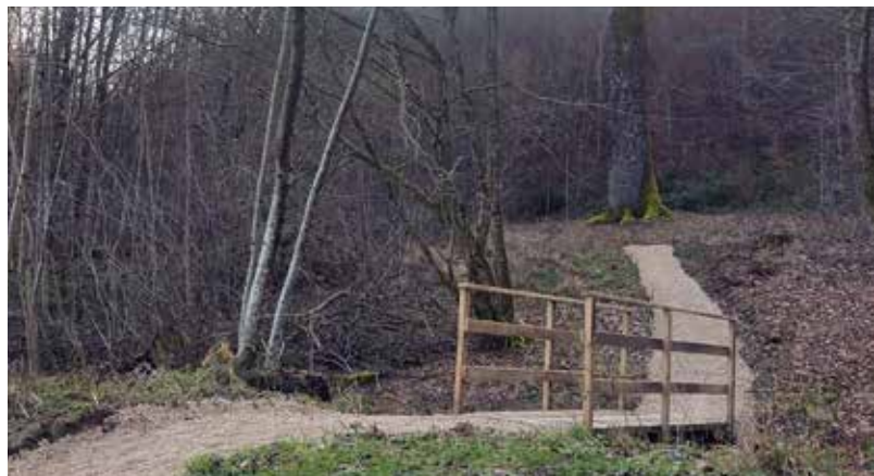
Accessibilité du Chêne Président