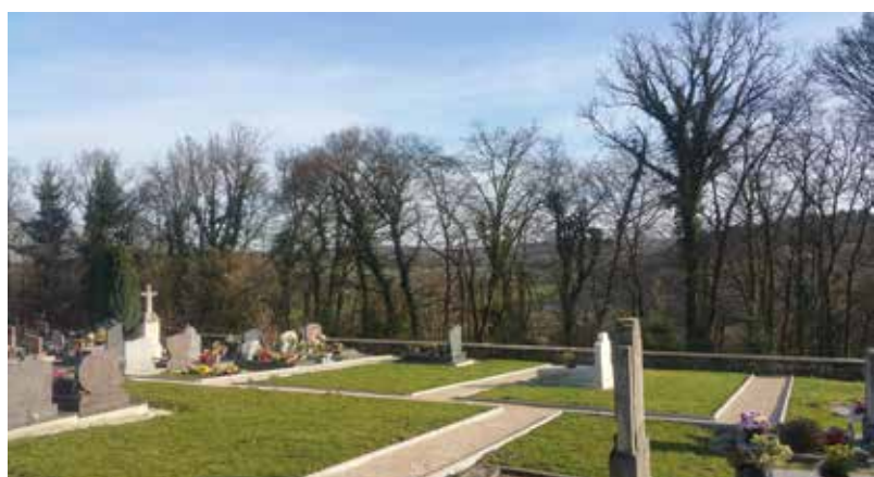
Aménagement du cimetière