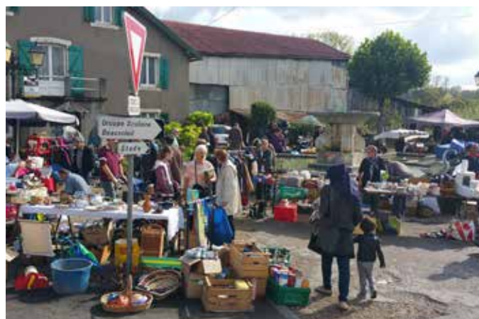
VIDE-GRENIER : 83 EXPOSANTS , UNE CENTAINE DE REPAS | Rendez-vous le 03 septembre 2016