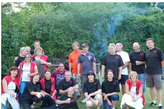
FEUX DE LA SAINT-JEAN : 120 CONVIVES AUTOURS DE LA CUISSE DE BŒUF | Rendez-vous le 25 juin 2016