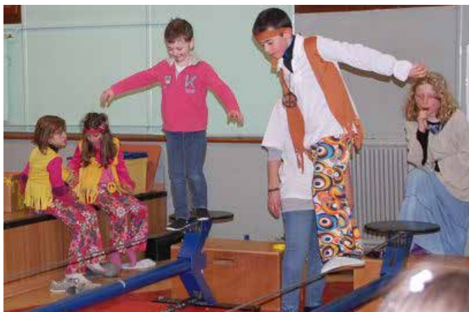
CARNAVAL avec la participation de CROC EN CIRQUE | Rendez-vous le 5 mars 2016