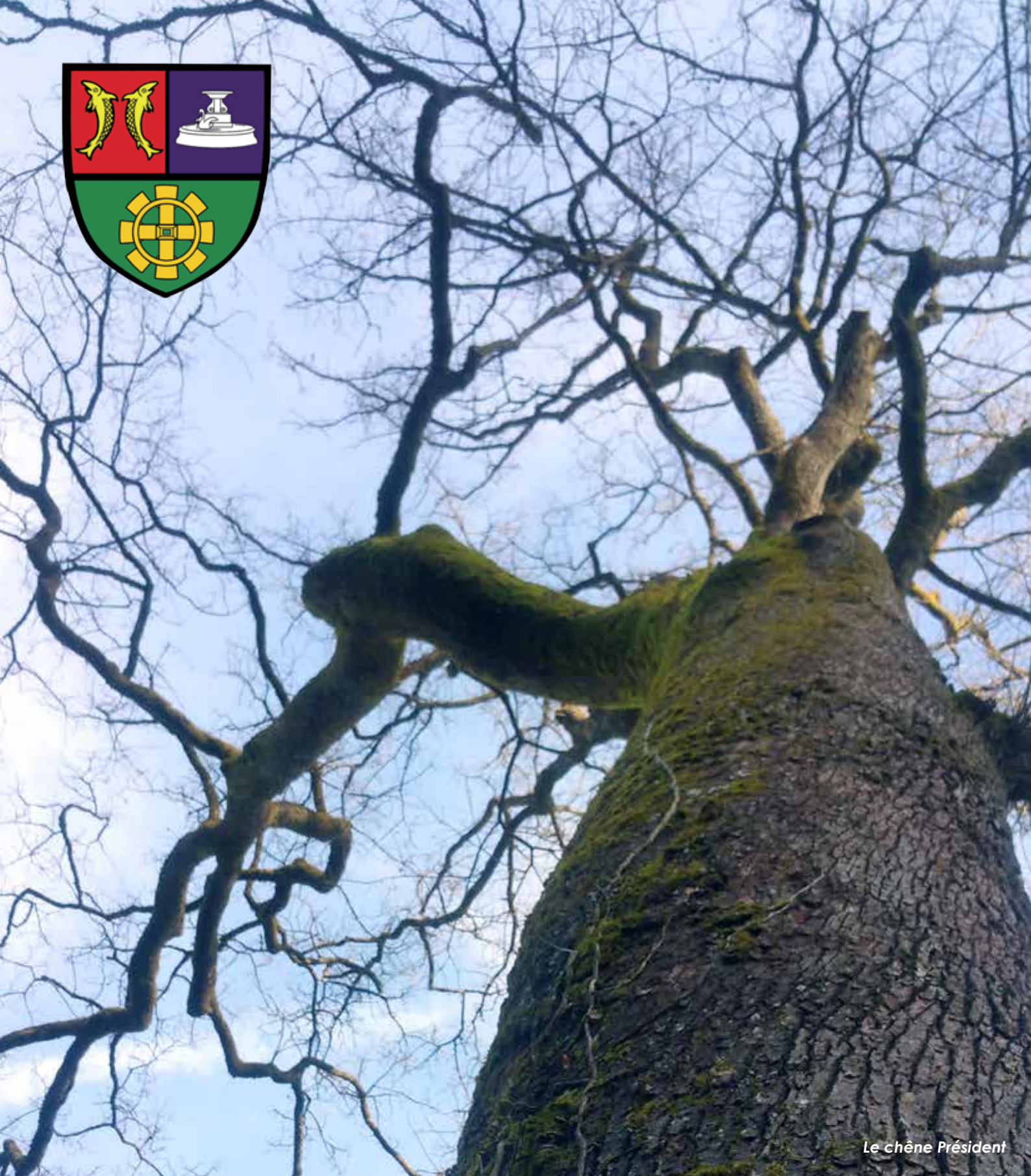
Le chêne Président

Bulletin municipal N°50 VIVRE À LOUGRES | 2016