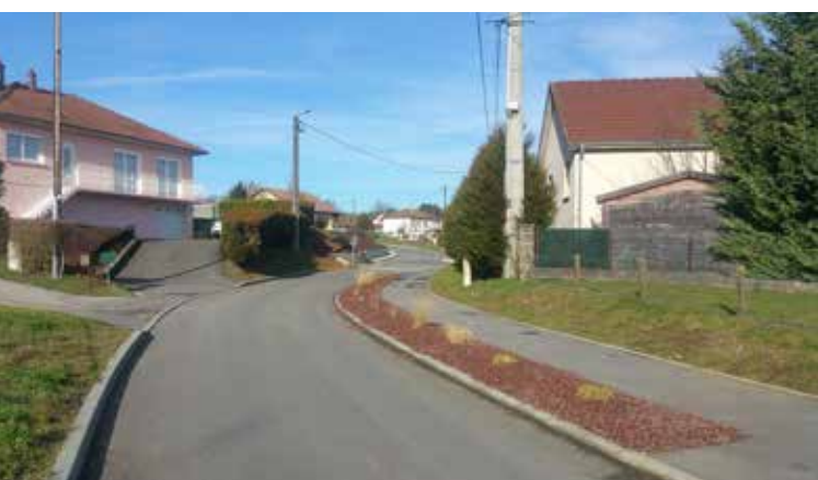
Bas de la rue de Sainte-Marie