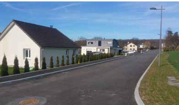
Finalisation de la rue du Chenois

Comme en 2014, l'année 2015 a vu beaucoup de travaux se réaliser dans notre commune de Lougres comme le montre les photos ci-dessous. Ces travaux importants ont notamment porté sur de la voirie et le réseau d'eau et d'assainissement.