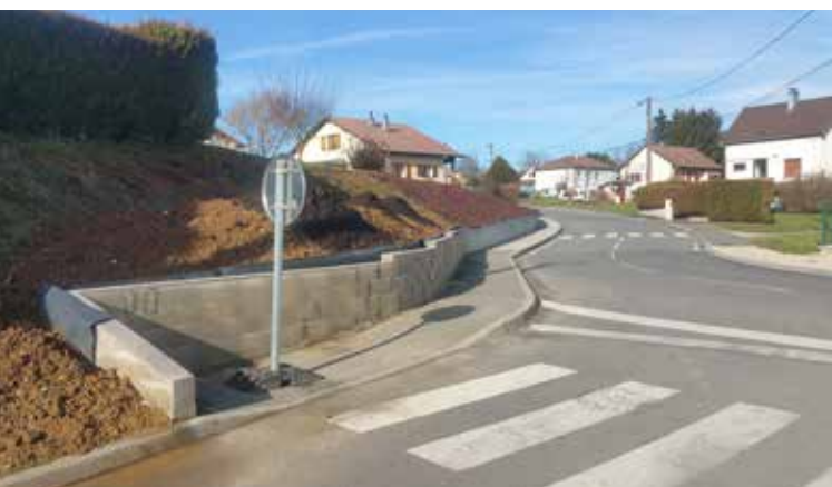
Mur de soutènement rue de Sainte-Marie