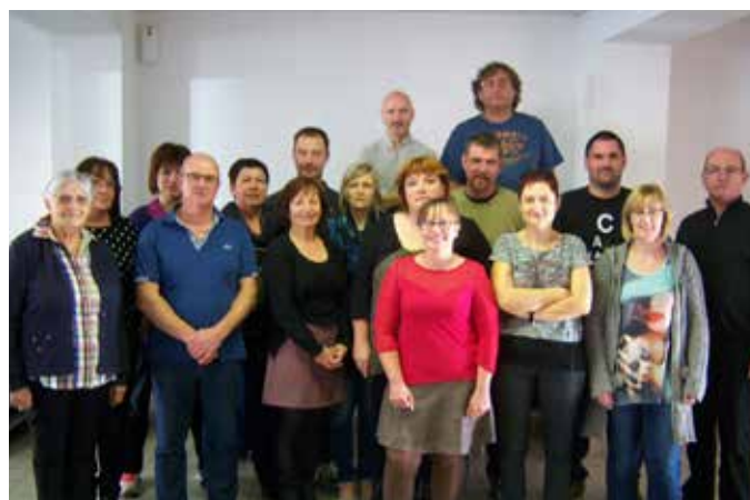
ASSEMBLÉE GÉNÉRALE : FÉLICITATIONS AUX MEMBRES POUR LEUR JOIE DE VIVRE... Rendez-vous le 05 novembre 2016