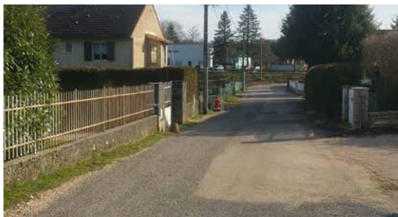
Travaux rue des Champs Marquis