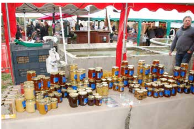
MARCHÉ NOCTURNE : 22 EXPOSANTS Rendez-vous le 15 octobre 2016