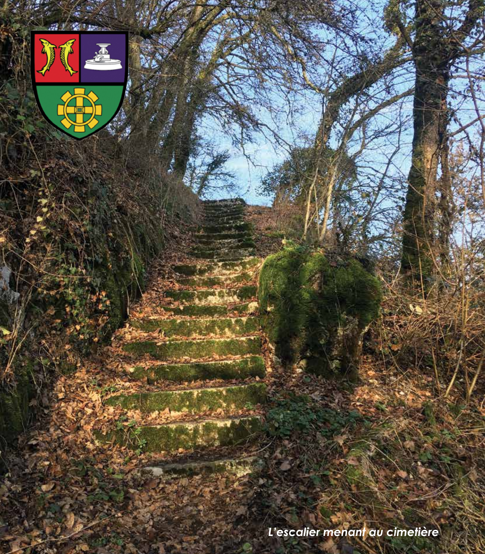
L'escalier menant au cimetière