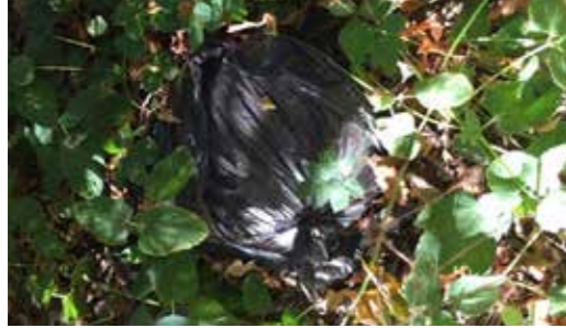
Dépôt sauvage de sapin de Noël, poubelle, plastique, papiers et autres surprises...